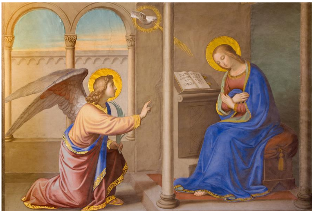
Figure 1 : Annonciation de l'Ange à Marie. Luc 1, 26-38.