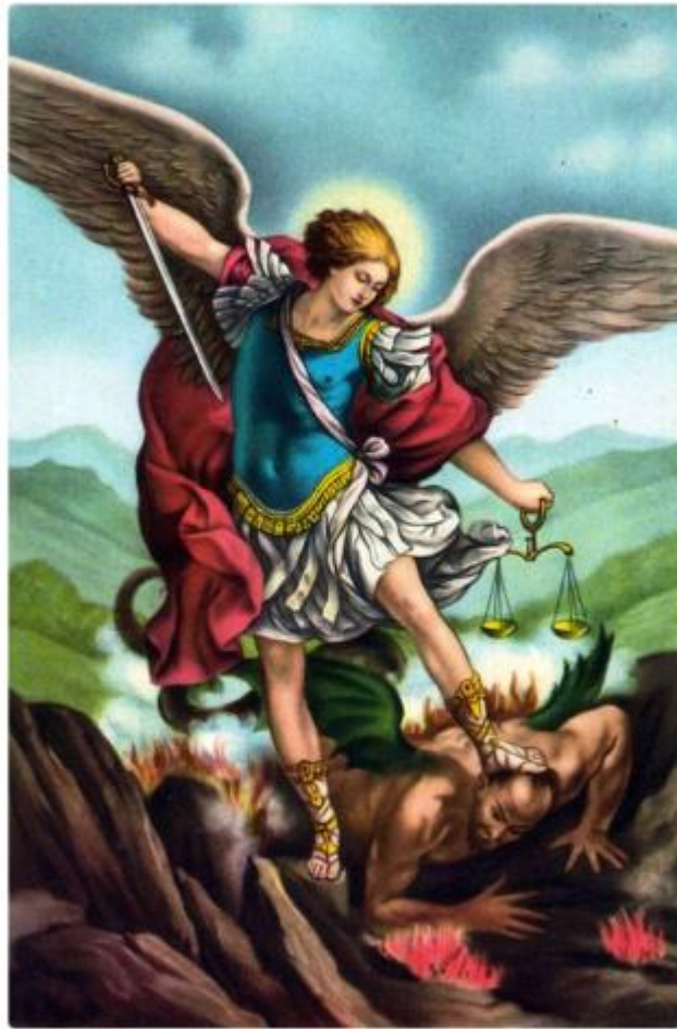
Neuvaine à Saint Michel Archange